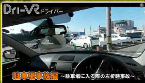
駐車場に入る際の左折時事故