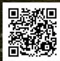
「駐車場事故編」 360° CM映像

今回は駐車場での車間距離を把握して頂く為、事故のシーンを同タイミングでドローン撮影しました。 ※「急なバックでの追突事故」にて使用しています。