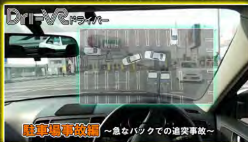
急なバックでの追突事故