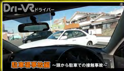
頭から駐車での接触事故