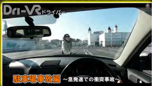
急発進での衝突事故