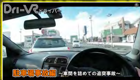
車間を詰めての追突事故