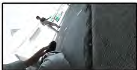
ホースやコードでの引っ掛かり転倒