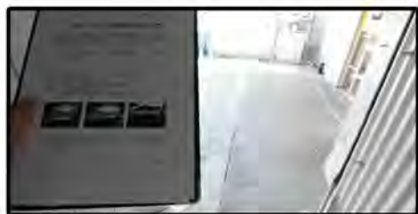
注意力不足での階段転倒