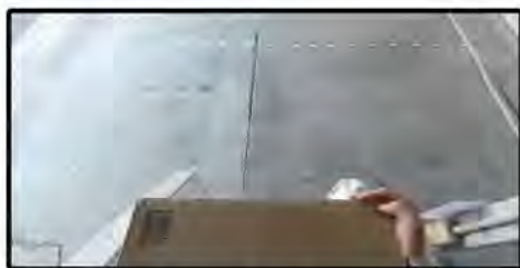
大きな手荷物をもつての階段転倒